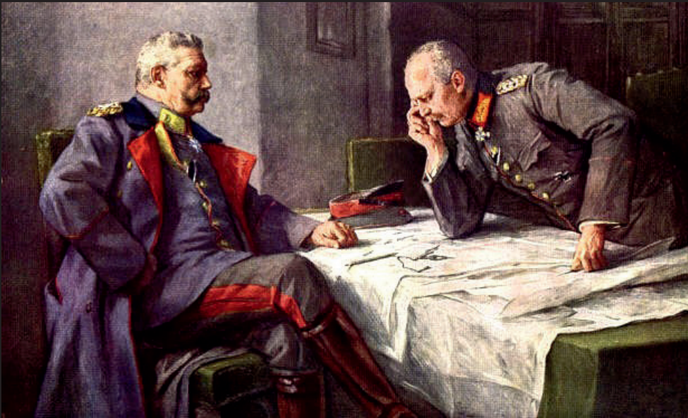
Feldmarschall Paul von Hindenburg* und General Erich Ludendorff*