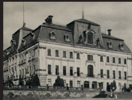
Deutsches Grosses Hauptquartier in Schloss Pless in Oberschlesien